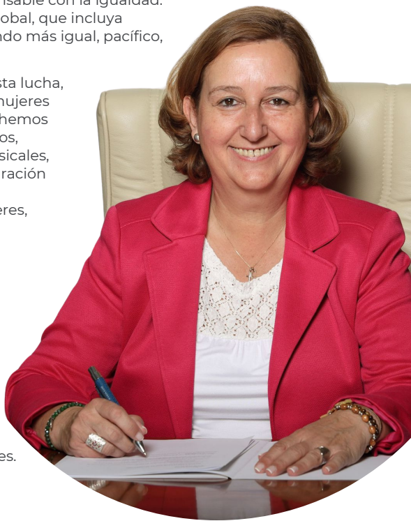
Concepción Cedillo Tardío PRESIDENTA DE LA DIPUTACIÓN DE TOLEDO

El hecho de que sea la primera mujer en presidir la Diputación es un símbolo de la apuesta de este Equipo de Gobierno por la igualdad, por lo que desde aquí os animo a celebrar juntos este día, con un horizonte claro de igualdad de oportunidades para hombres y mujeres y logrando así alcanzar las metas comunes.