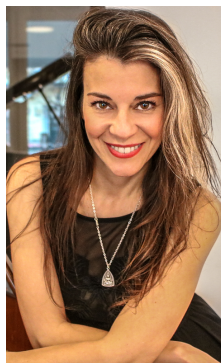
Pilar Gual Actriz / Soprano