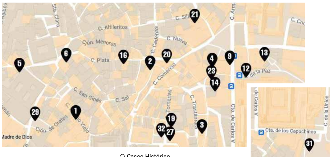
Q Casco Histórico